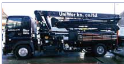
8.0t車(ピストン26mブーム) 大型

<車両>全長:6,740mm×全幅:2,060mm ×全高:2,790mm 車両総重量:7,200kg