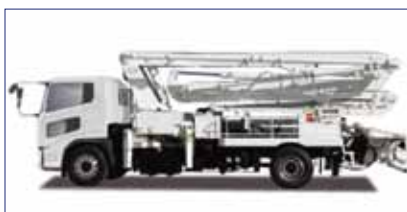
8.0t車(ピストン26mブーム) 大型

<車両>全長:9,800mm×全幅:2,490mm ×全高:3,500mm 車両総重量:16,145kg